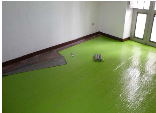
Der Boden im Schulzimmer der 2. Primarklasse, März 2019