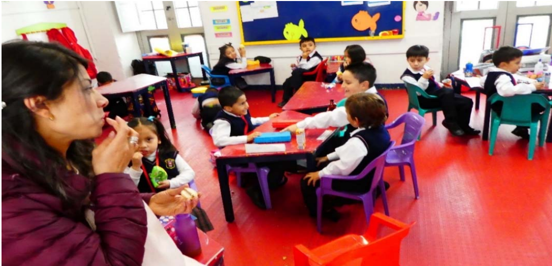
SchülerInnen der ersten Primarklasse November 2019

Da die Schule nach der Sanierung der Infrastruktur moderner geworden ist und die Qualität der Ausbildung auch gut ist, sind weitere Eltern motiviert, ihre Kinder und Jugendlichen in unserer Schule zu immatrikulieren.