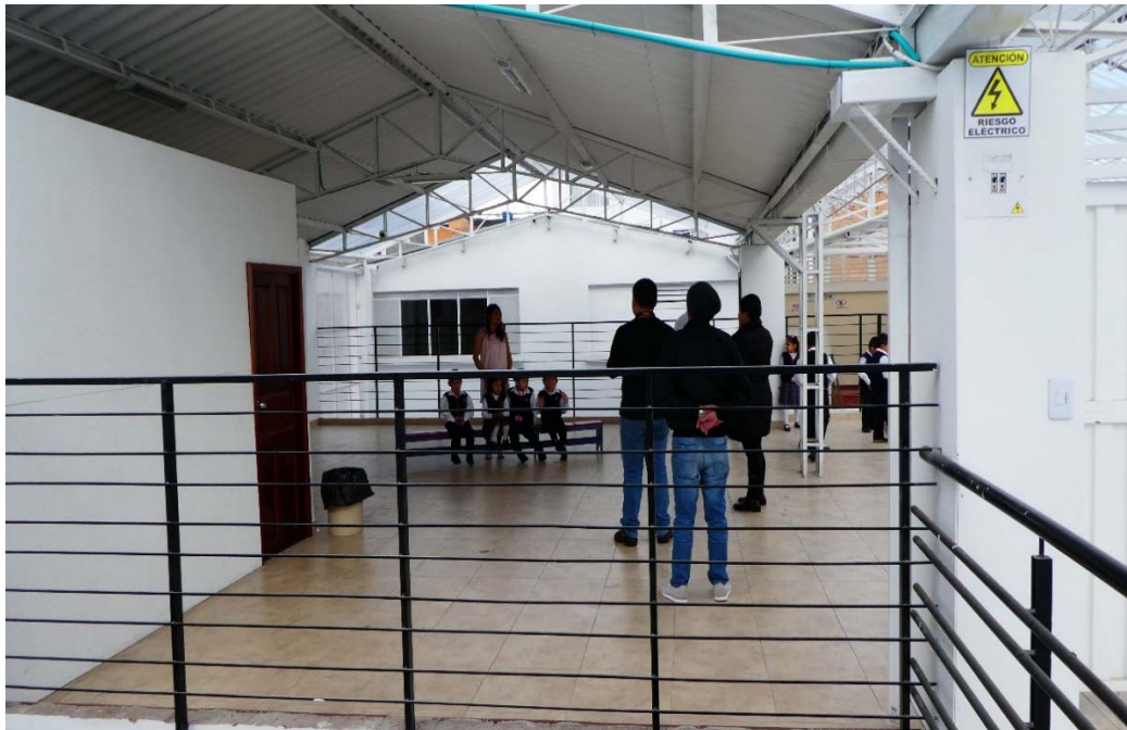
So sah die Terrasse der Schule im Oktober 2018 vor dem Bau der zwei kleinen Klassenzimmer aus.

Per 1. Januar 2020 ist in Kolumbien ein neues Steuergesetz in Kraft getreten. Dieses ersetzt die im Oktober 2019 vom Verfassungsgerichtshof aufgehobene Steuerreform. Die aktuelle Steuerreform soll das Haushaltsdefizit ausgleichen.