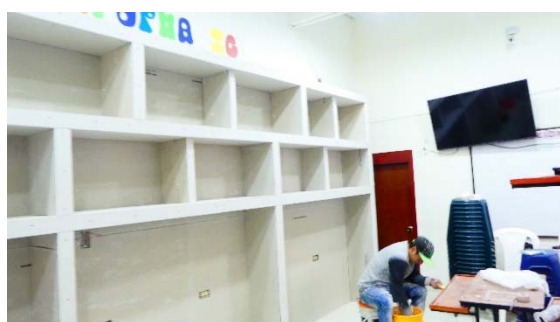
Angemessenheit der Bibliothek für das Jahr 2020