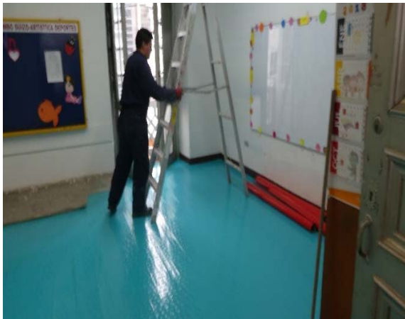
Neuer Boden im alten Gebäude, März 2019

Dank der Spenden im Jahr 2019 aus der Schweiz von 13'985 CHF konnten wir diese Kosten decken.