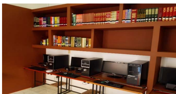
Die neue Bibliothek und der Computerraum mit 15 Plätzen