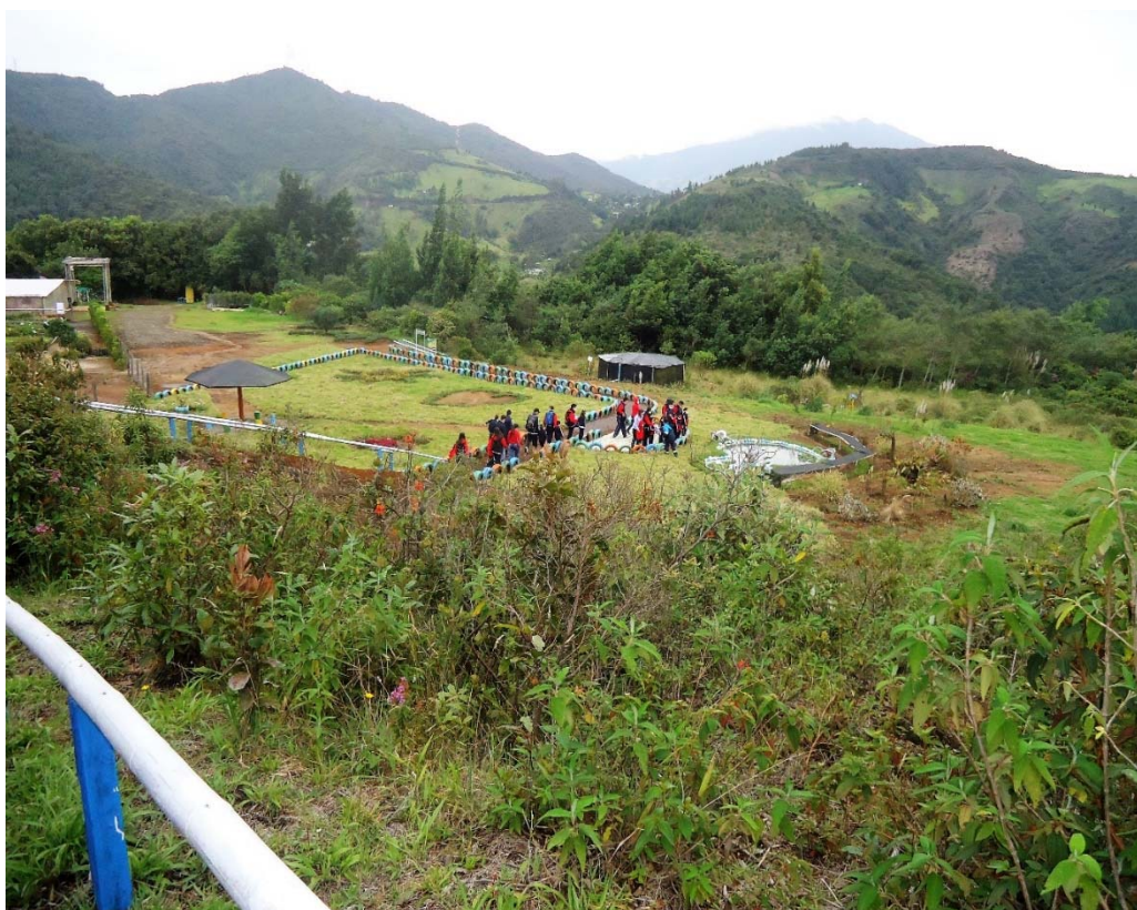
Vertreibungen und mangelnde Unterstützung für Landwirte sind eine Ursache der Arbeitslosigkeit.

Bevor ich am 28. Januar 2020 nach Kolumbien fliege, möchte ich euch über verschiedene Ereignisse, welche die Schule «Colombo Suizo» Pasto im Jahr 2019 erlebte, berichten. Insgesamt betrachten wir das Jahr 2019 für die Schule und den Verein «Nueva Cultura» als sehr positiv. 170 SchülerInnen begannen das Schuljahr 2019 und 160 beendeten die Schule problemlos. Die 10 SchülerInnen, die ausgetreten sind, wechselten aufgrund eines Umzugs an andere Schulen.