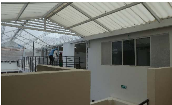
Die zwei neuen Klassenzimmer auf der Terrasse