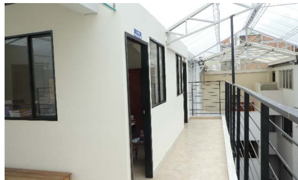
Die zwei Klassenzimmer fertig gebaut März 2019