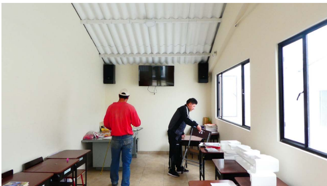
Das neue Klassenzimmer auf der Terrasse mit einem Fernseher für Projektionen im Unterricht.

Gemäss diesen Statistiken kann die Schule «Colombo Suizo Pasto» auch im Jahr 2019 eine gute Bilanz ziehen.