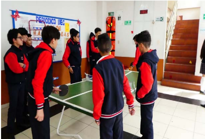
Schule Colombo Suizo November 2019

Langfristig sollte die Schule bis 2022 die Zwischenböden im 1. Stock des alten Hauses sanieren.